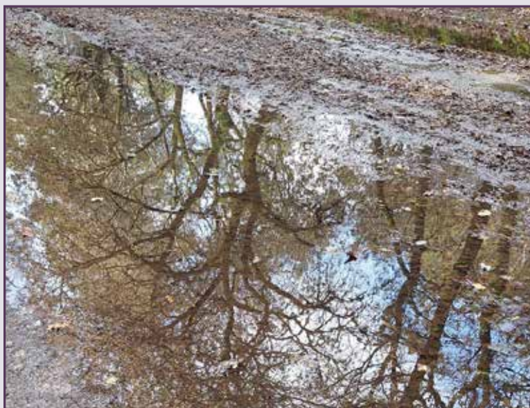
Follow the Rain, צילמה: ציפי הראל

ציפי הראל, בעלת תואר ראשון בפילוסופיה ובמדעי החברה ותואר שני בסוציולוגיה. ילידת רמת גן. ספריה הקודמים: "איך זה שהמים שקטים" (2017), "לילות ונביחות" (2019), שניהם בהוצאת פיוטית של שושנה ויג. השלישי, "קווים ונקודות" (2021), בהוצאת עמדה של רן יגל.